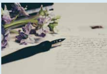
Pisma stanovalcev Stran 6