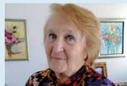
Povedali so ... Stran 11