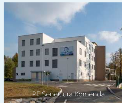
PE SeneCura Komenda

Upamo, da nam bo »vreme« naklonjeno tudi v prihodnje in bodo vse tri poslovne enote zaživele takrat in tako, kot smo si zamislili in si želimo ... Blizu ljudem.