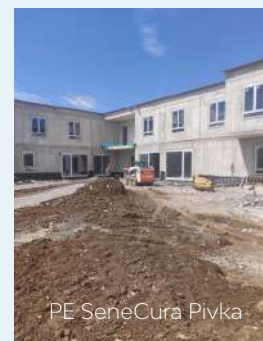
PE SeneCura Pivka